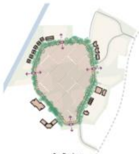
2 - De lus