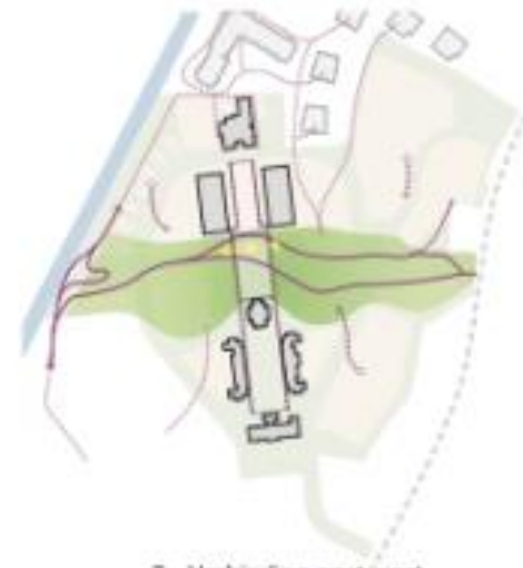
3 - Verbinding oost-west