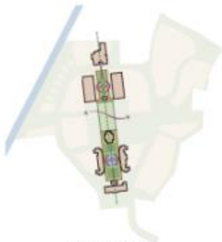
1 - De centrale AS