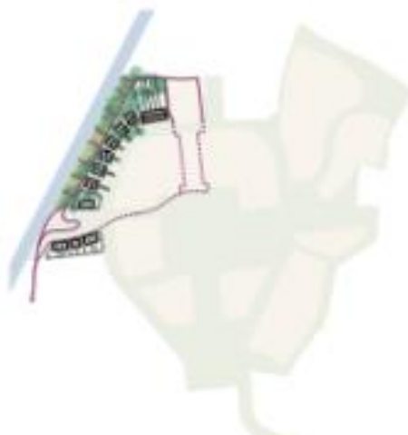
5 - Groen langs de Leidsevaart