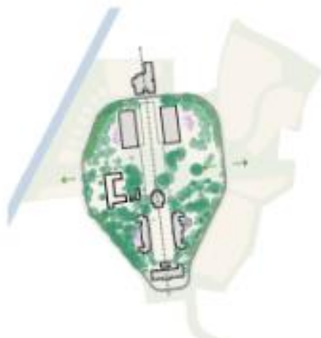
4 - Groene kamers